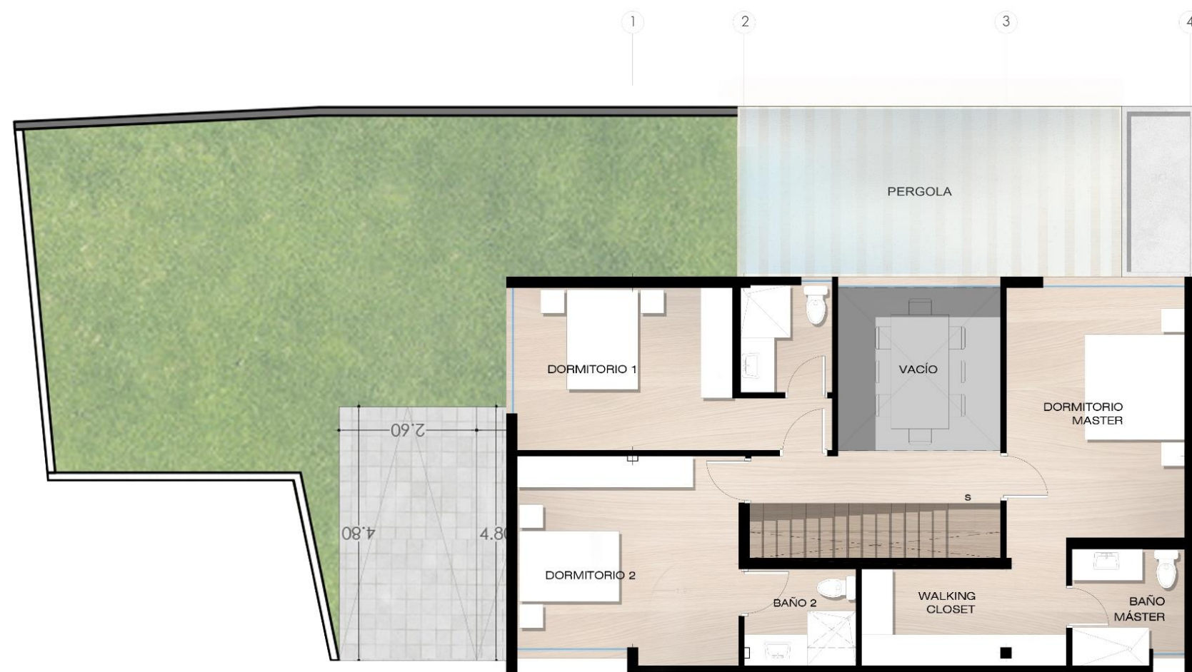
PLANTA ALTA CASA 1 AREA: 98,90m 2

CASA 1 Área : 218,41m 2 Área Verde: 78,03m 2