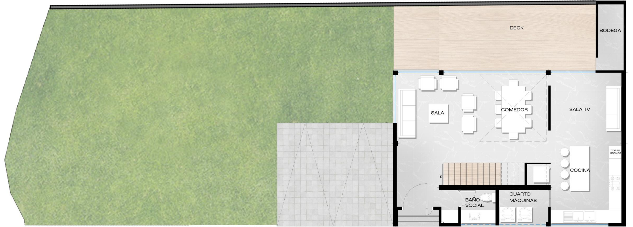
PLANTA BAJA CASA 1 AREA: 128,80m 2