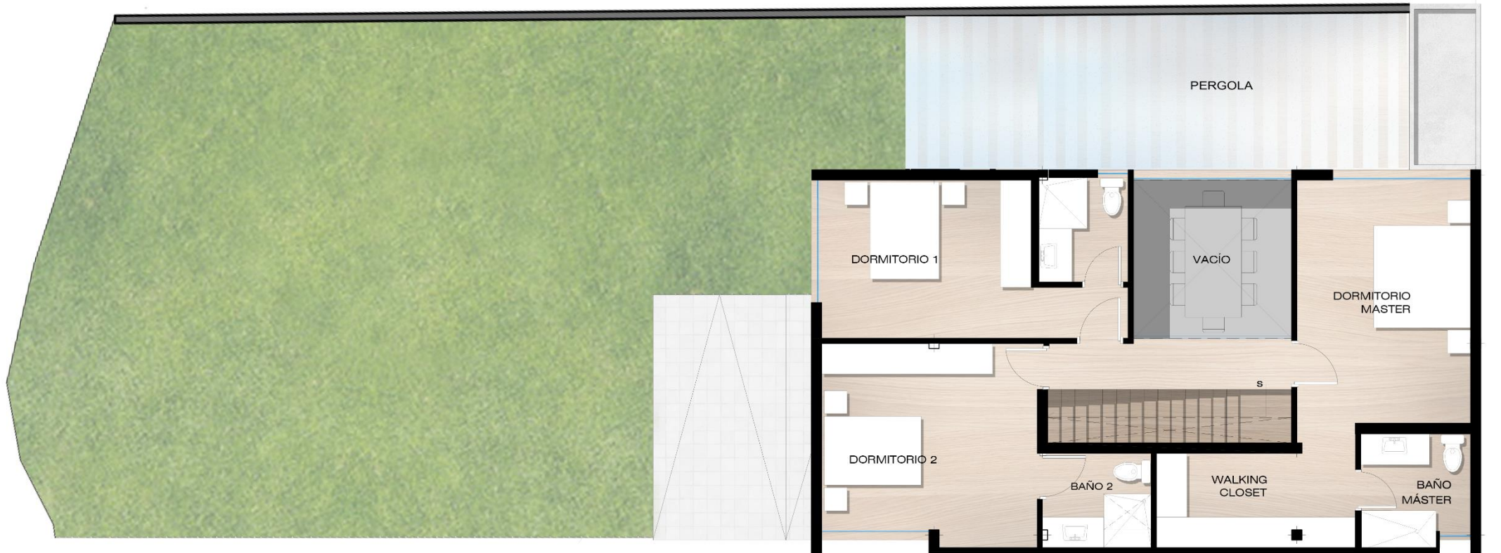
PLANTA ALTA CASA 1 AREA: 98,90m 2