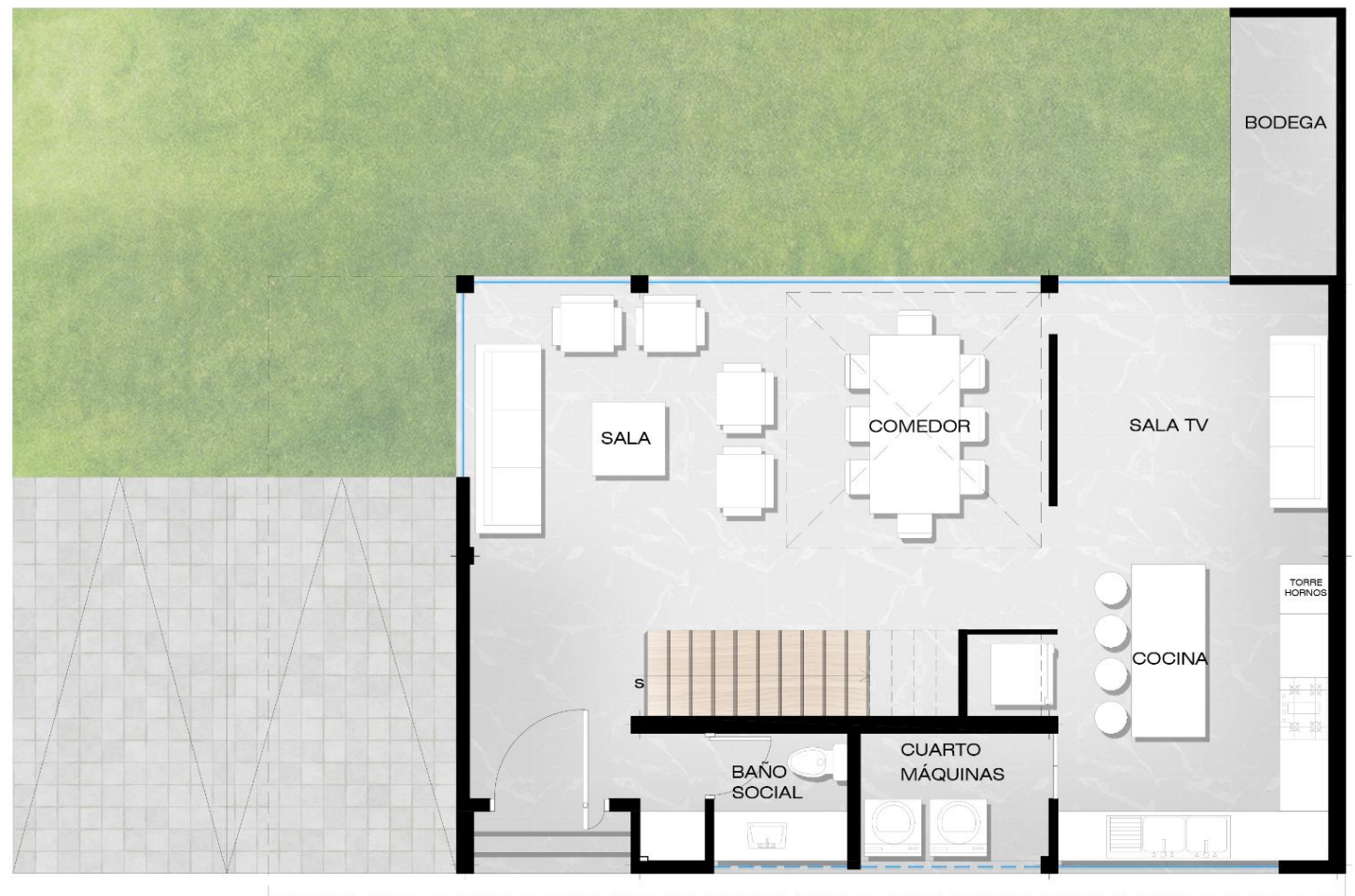
PLANTA BAJA CASA TIPO A AREA: 96,22m 2