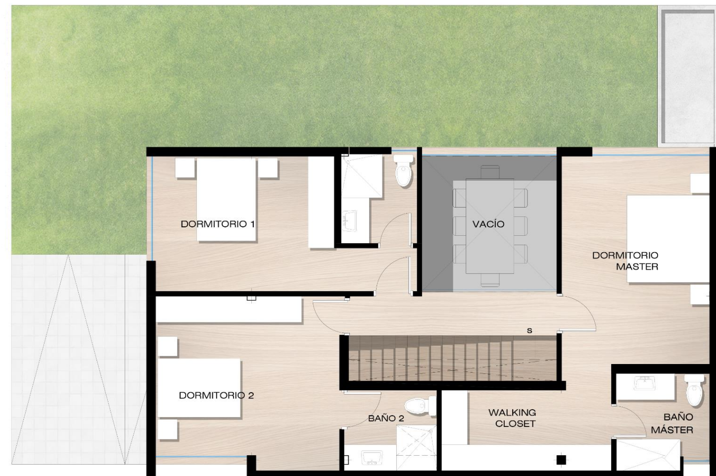
PLANTA ALTA CASA TIPO A AREA: 98,90m 2