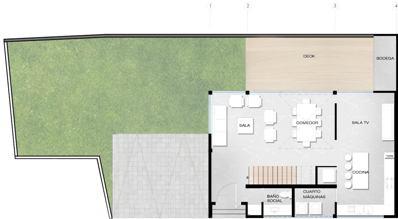
PLANTA BAJA CASA 1 AREA: 119,51m 2